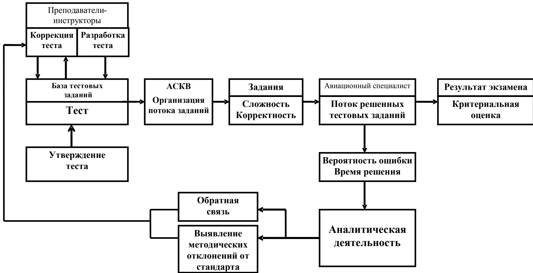
Рис. 3. Структурная схема деятельности в системе качеств на уровне 2